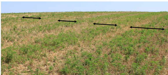
« Bandes d'ambrosies » laissées par la moissonneuse-batteuse