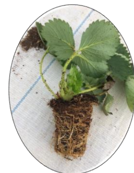
Trayplant et minitray de très bonne qualité.