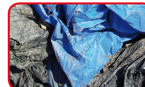
Films mélangés, en vrac