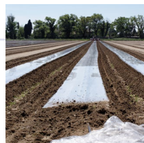
Films de paillage clair