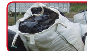
Films dans big bag