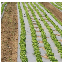
Films de paillage couleur