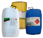
Fûts de produits phytopharmaceutiques et oligo-éléments