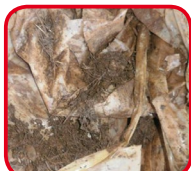
Présence de terre et d'autres produits : pneus, big bag, ficelles...