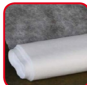
Voile non tissé, dont le P17