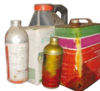
PPNU (Produits Phytopharmaceutiques Non Utilisables)