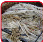
Présence de végétaux