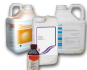
Bidons en plastique de produits phytopharmaceutiques et oligo-éléments