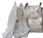
Big bags de produits fertilisants, semences et plants