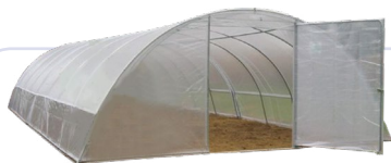
Couvertures de serres

Attention : ne pas mélanger les différentes classes de films entre elles !