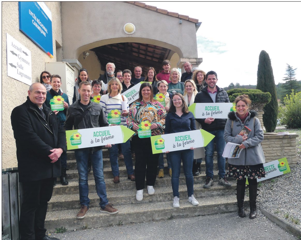
Les adhérents de l'association Bienvenue à la ferme Alpes-Provence prennent la pose à l'issue de l'assemblée générale qui s'est tenue le 23 mars au lycée de Carmejane.

Cependant, pas question d'en rester là ! « Ce chiffre peut encore progresser grâce à vous tous et toutes, exhortait-elle. Car, chacun d'entre vous est le meilleur ambassadeur de notre réseau. » Depuis 2018, l'association affiche une évolution constante de son nombre d'adhérents (voir graphique ci-contre) et en 2022 ils ont été neuf à adhérer (voir encadré) et quatre à résilier. L'objectif affiché des trois prochaines années est de conserver