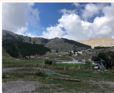
Alpages à Auron en Tinée