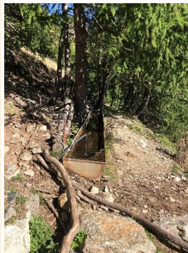
Abreuvoirs à Anduébis en Vésubie