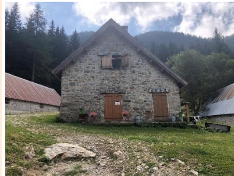
La vacherie du Boréon