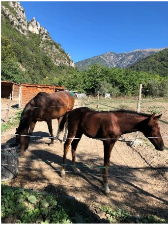
Écuries à Roquebillière

La phase d'enquête se poursuit jusqu'à mi-octobre.