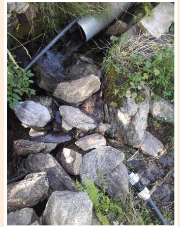
Prise d'eau alimentant une exploitation à Isola