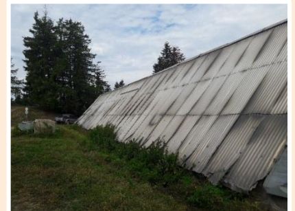
Vacherie de Mantégas au col de Turini