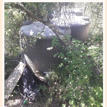
Citernes pour l'abreuvement à Sospel