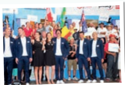
Figure 1 : Équipe de France au complet entourée des autres nations participantes