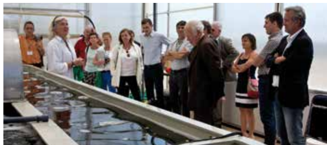
Présentation d'une culture d'algue dans le cadre du projet ANR URPLE SUN