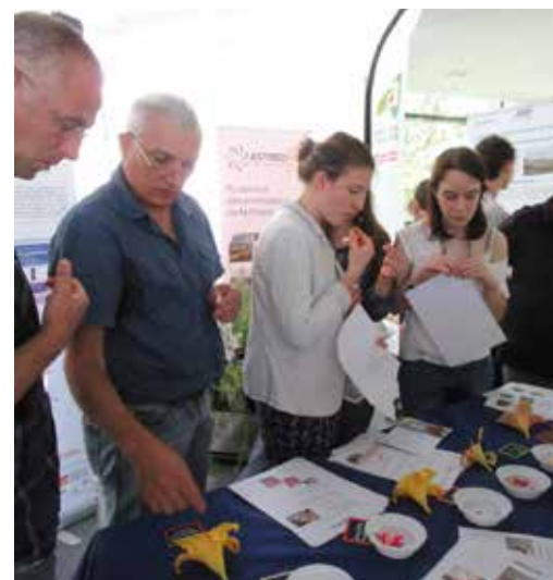
La Chambre d'agriculture a présenté 15 variétés de fleurs comestibles, testées au CREAT